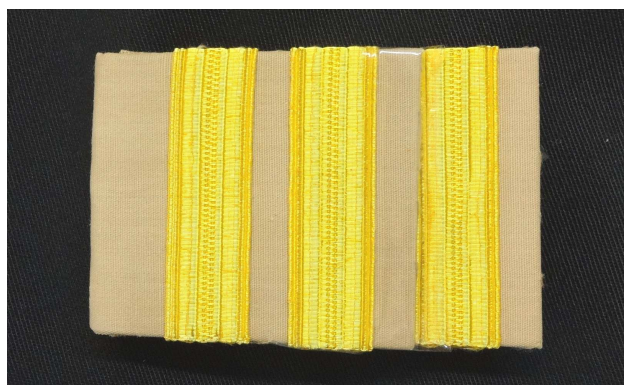
พนักงานราชการพิเศษ

อินทรรูป ให้ใช้อินทรรูปอ่อน มีเครื่องหมายบนอินทรรูปดังนี้ ๑. พนักงานราชการทั่วไป มีแถบกว้าง ๑ เซนติเมตร ๒ แถบ ๒. พนักงานราชการพิเศษ มีแถบกว้าง ๑ เซนติเมตร ๓ แถบ แถบล่างกล่าวให้ใช้สีเหลืองหรือสีทอง การติดแถบลให้ติดตามขวางที่ต้นอินทรรูป แถบลแรกห่างจากต้นอินทรรูป ๕ มิลลิเมตร และแถบลต่อไปเว้นระยะห่างกัน ๕ มิลลิเมตร