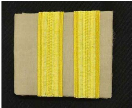
พนักงานราชการทั่วไป