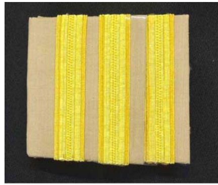
พนักงานราชการพิเศษ

อินทรธนู ให้ใช้อินทรธนูอ่อน มีเครื่องหมายบนอินทรธนูดังนี้ ๑. พนักงานราชการทั่วไป มีแถบกว้าง ๑ เซนติเมตร ๒ แถบ ๒. พนักงานราชการพิเศษ มีแถบกว้าง ๑ เซนติเมตร ๓ แถบ แถบดีงกล่าวให้ใช้สีเหลืองหรือสีทอง การติดแถบดีงกล่าวให้ติดตามขวางที่ต้นอินทรธนู แถบแรกห่างจากต้นอินทรธนู ๕ มิลลิเมตร และแถบดีงกล่าวเว้นระยะห่างกัน ๕ มิลลิเมตร