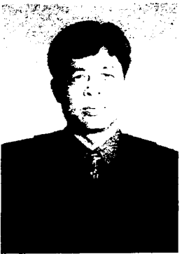
นายจักริน วงศ์กุลฤดี อธิบดีศาลปกครองขอนแก่น