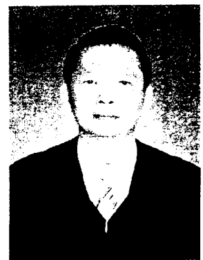
นายอำพน เจริญชินทร์ อธิบดีศาลปกครองเพชรบุรี