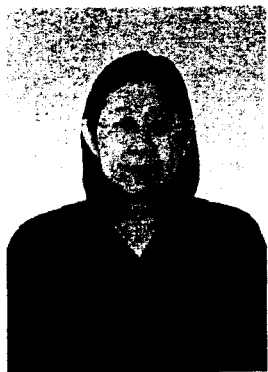
นางสุกัญญา นาชัยเวียง อธิบดีศาลปกครองเชียงใหม่