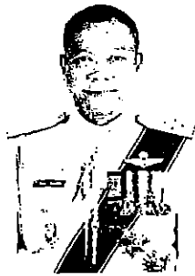
๒๗. พลตำรวจเอก วิทยา ประยงค์พันธุ์ ที่ปรึกษาพิเศษ สำนักงานตำรวจแห่งชาติ