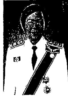
๑๔. นางสาวปิติกาญจน์ สิทธิเดช อธิบดีกรมคุ้มครองสิทธิและเสรีภาพ กระทรวงยุติธรรม