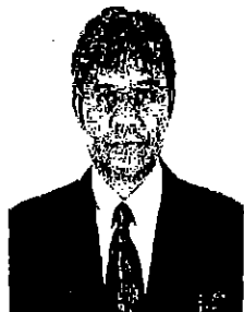
๒๓. นายปรีดา เวทย์วงศ์ รองเลขาธิการสำนักงานผู้ตรวจการแผ่นดิน