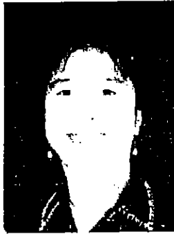
๓๑. นางสาวพรประไพ กาญจนรินทร์ อดีตเอกอัครราชทูต ณ กรุงเฮก ประเทศเนเธอร์แลนด์